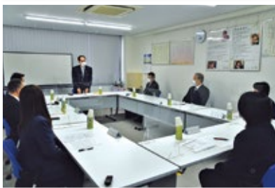
【県知事との意見交換会】