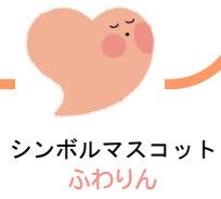
シンボลมスコット ふわりん