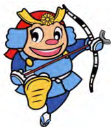
香川県警察シンボลมスコット 「ヨイチ」

警察では、犯罪が発生した直後から被害者等に寄り添い、ご要望に沿えるよう全力で被害者支援活動を展開しているところであります。しかしながら、犯罪被害者の方々を精神的、物質的にしっかり支え、元の平穏かつ安心できる生活を取り戻していただくためには、警察の支援活動だけでは十分とはいえません。犯罪被害者等のニーズを踏まえて、真に求められる支援を的確、迅速に進めるためには、警察はもとより、行政機関や関係団体、そして何より、香川県公安委員会から公的認証である「犯罪被害者等早期援助団体」としての指定を受けている貴センターとの密接な連携が必要不可欠であります。